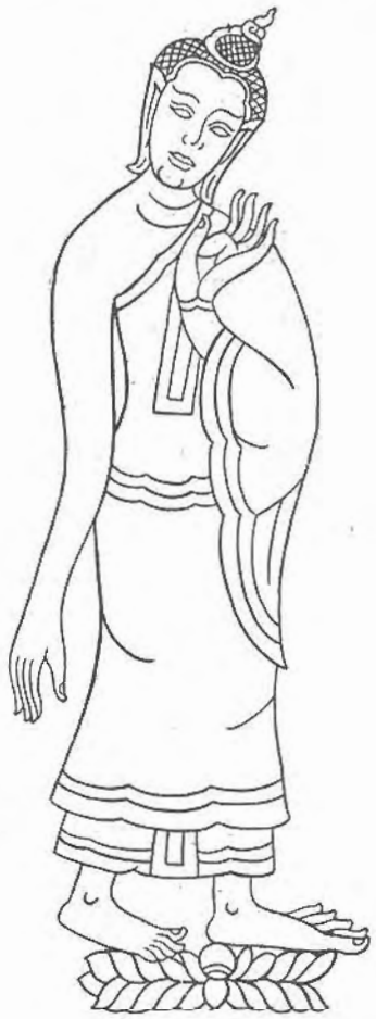
ลวดลายจารึกบนแผ่นทองสัมฤทธิ์ สมัยสุโขทัย อายุหลังจากจารึกบนแผ่นศิลาวัดศรีชุมประมาณ ๕๐ ปี เป็นที่สังเกตได้ง่ายว่า ลักษณะแบบไทยได้ปรากฏแสดงออกเป็นลักษณะประดิษฐ์อันเป็นแบบแผนสืบเนื่องมาจนถึงทุกวันนี้

ภาพลายประคียบคกแต่งผนังโบสถ์วิหารของสุโขทัย มีลักษณะลวดลายหรือกล่าวแทบทั้งหมด คือ สัตินคางและสีคำที่ใช้เป็นผลได้คินทางกอิอาริสกโร คือ