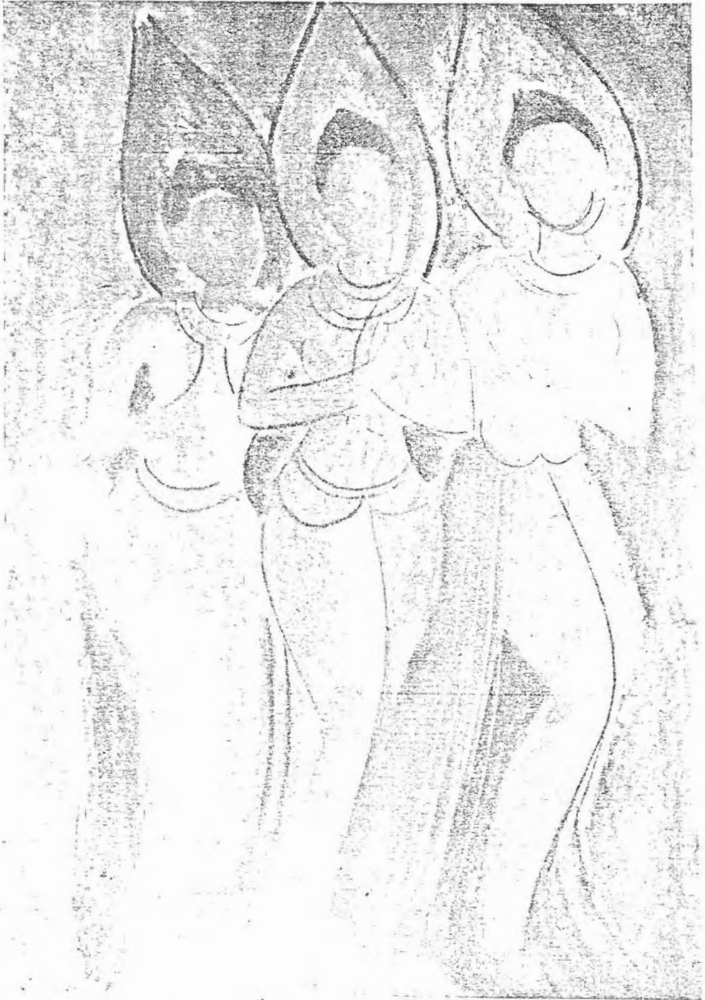
รูปที่ ๒ ภาพจิตรกรรม ภาพนูนต่ำศิลป จังหวัดระยอง ที่มีอักษรถูกถอดของ นายมานิตย์ ภู่อารีย์