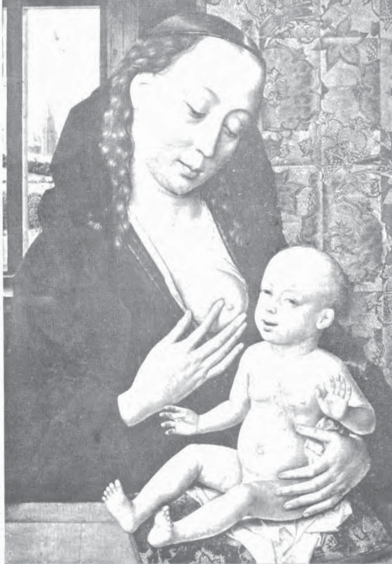
รูปที่ ๕ The Virgin and Child ของ ไตรีก บุตส์ (๑๔๔๗-๑๔๗๕)