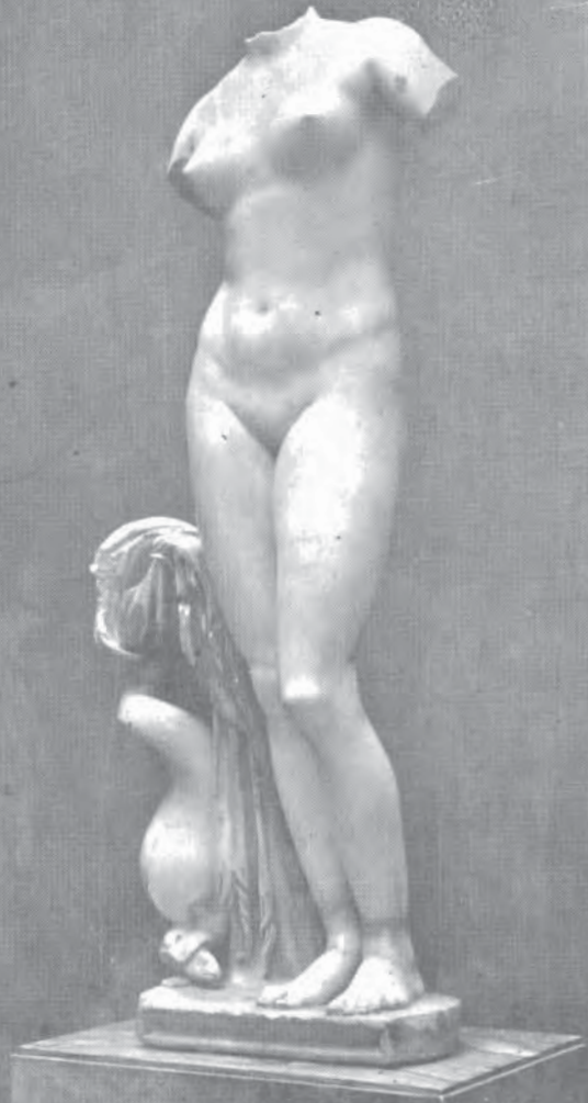
348 - ROMA - VENERE DI CIRENE - (MUSEO NAZIONALE ROMANO)

รูปที่ ๔ เทพธิดาวัลส์ ณ เมืองซิเรนี พิพิธภัณฑสถานแห่งชาติ กรุงโรม